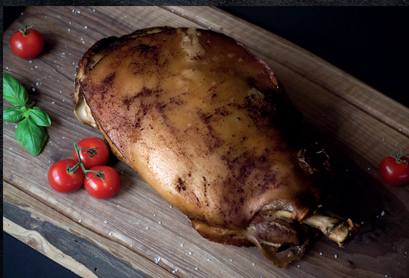
Pečené bravčové stehno pre 20 osôb.

možnosť konzultácie objednávky priamo u vás doma v rámci Čadce.