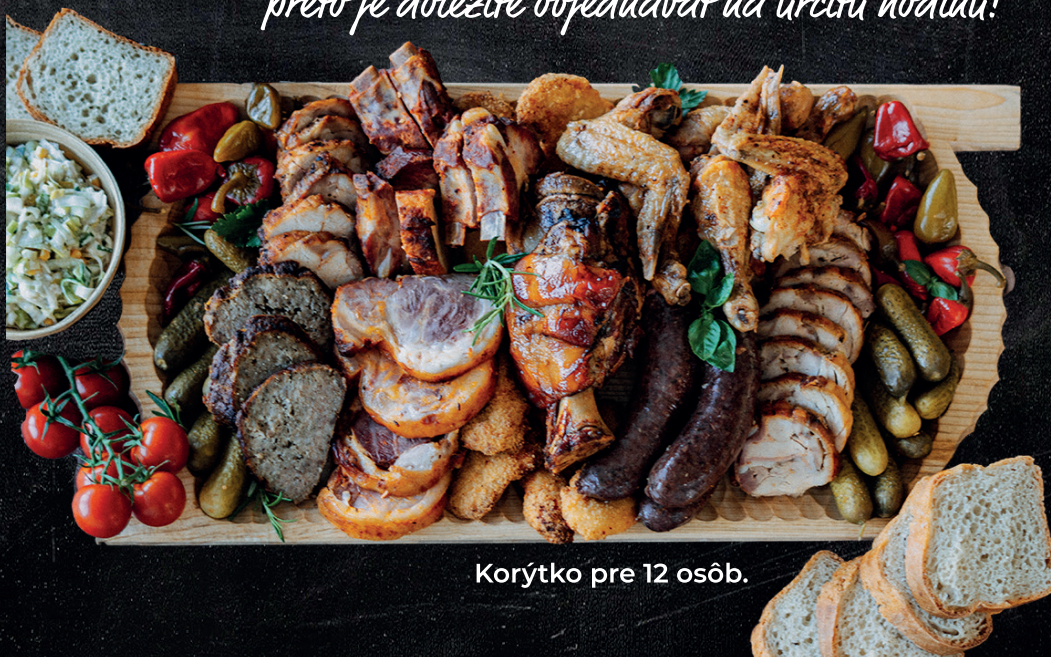
Korýtko pre 12 osôb.

Korýtko a misy odovzdávame vždy teplé, preto je dôležité objednávať na určitú hodinu!