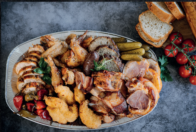
Misa pre 10 osôb.

Pri nákupe nad 70 € získaj zľavovú kartu, -20% na celú ponuku! (karta platí neobmedzene)